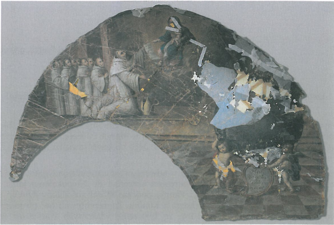
Obraz przed konserwacją rozpoczętą w 2011 roku przez p. Annę Czerwińską